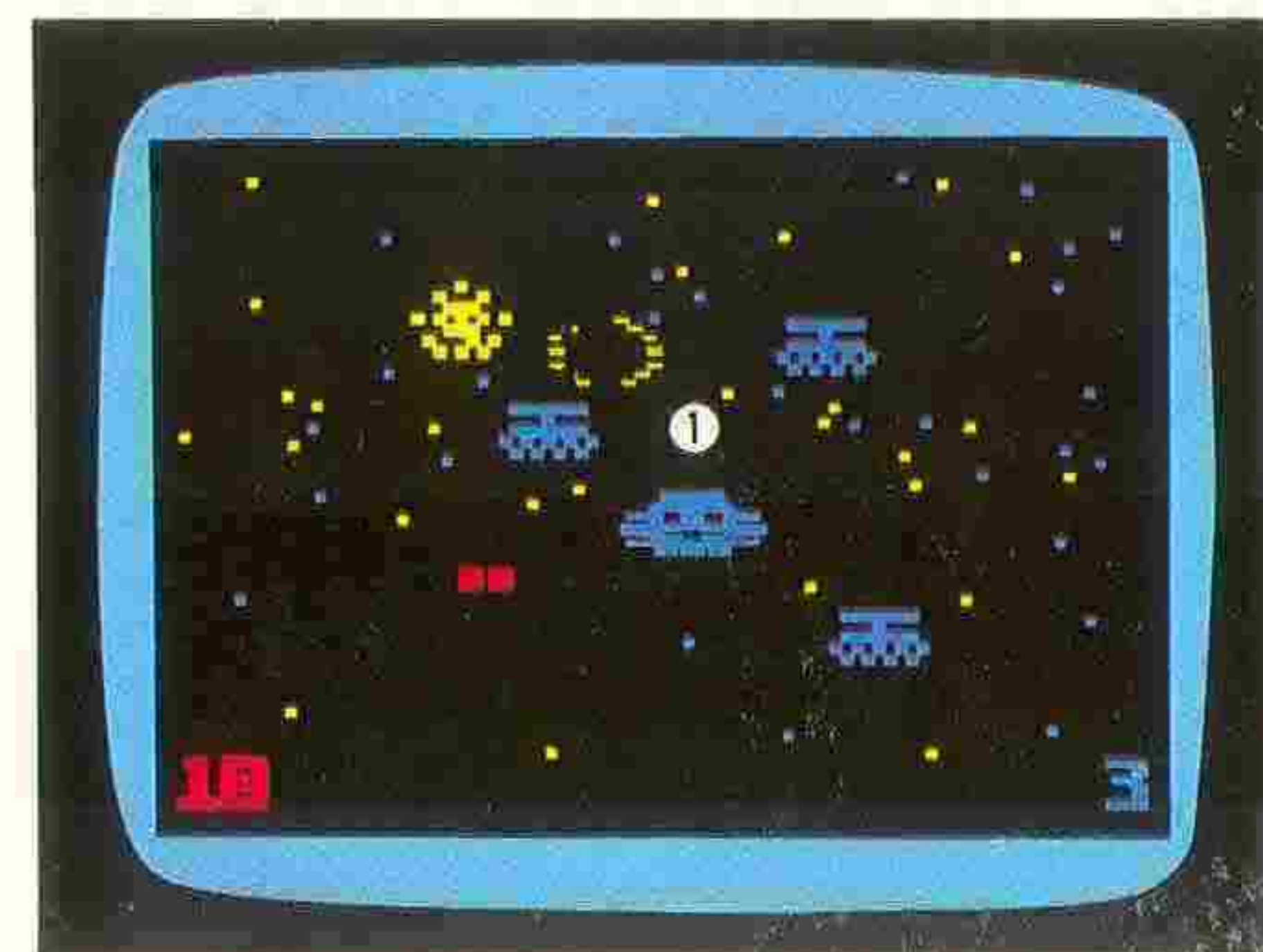
①エイリアン宇宙船団

緊急警報 — エイリアン戦隊が接近中! レーダーで敵の位置を確認し迎撃戦闘機を出撃させる! 照準器を敵機に……レーザーガン発射! エイリアンとの宇宙大戦の火ぶたが切って落とされた!